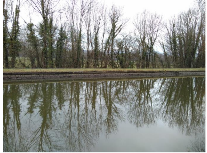
Figure 11. Vue depuis la rive opposée du système de protection alternatif en plaques de béton (observation : bonne intégration dans le paysage et recolonisation de la végétation)