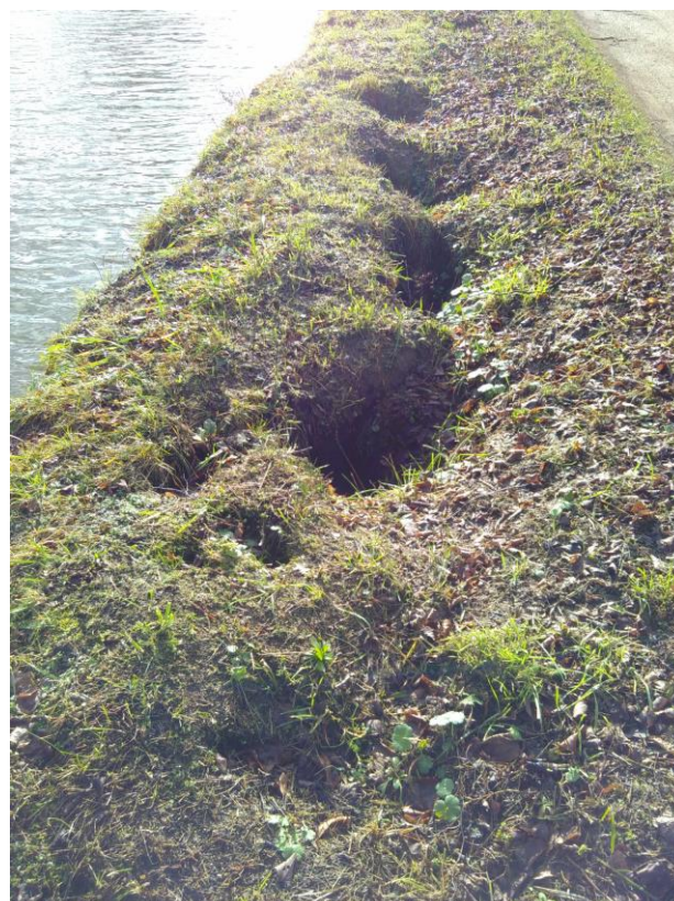
Figure 7. Système de protection par big bags géosynthétique remplis de graves diverses (observation : érosion très forte entre et derrière les big bags entraînant une déstructuration de la berge)