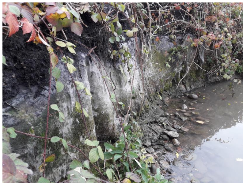
Figure 5. Dégradation complète du système de protection géosynthétique entraînant un recul très important de la berge