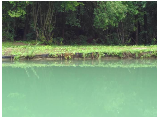
Figure 2. Même système vu depuis la berge opposée (observation : bon maintien de la structure de la berge)