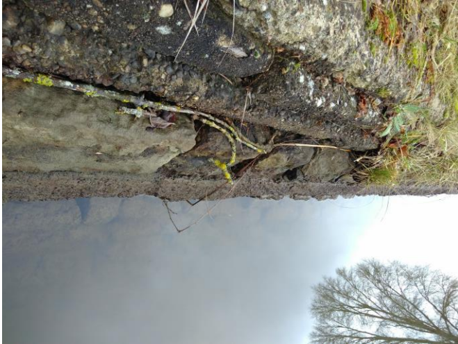
Figure 10. Système de protection de berge alternatif issu du recyclage de plaque béton posées à plat par-dessus la maçonnerie d'une berge, dans une zone à fortes contraintes (batillage)