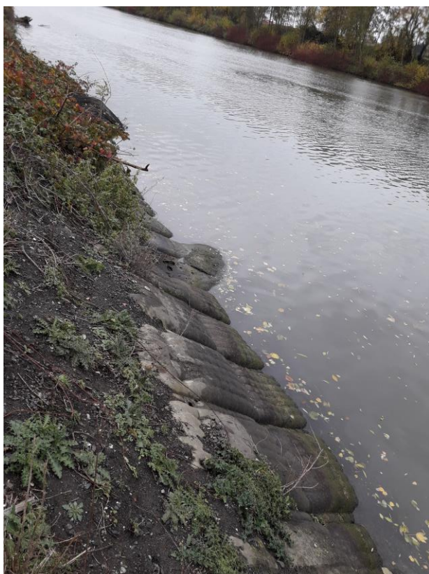
Figure 6. Système de protection en nappe géosynthétique dans laquelle du béton a été coulé (observation : zone très pentue ne permettant pas aux animaux de remonter facilement, pas de recolonisation de la végétation, zone à risque en cas de grand froid)