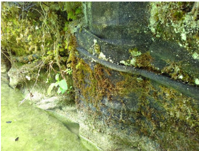
Figure 1. Photographie du géosynthétique dans la zone de batillage (observation : peu de dégradation due au batillage ou à la végétation)