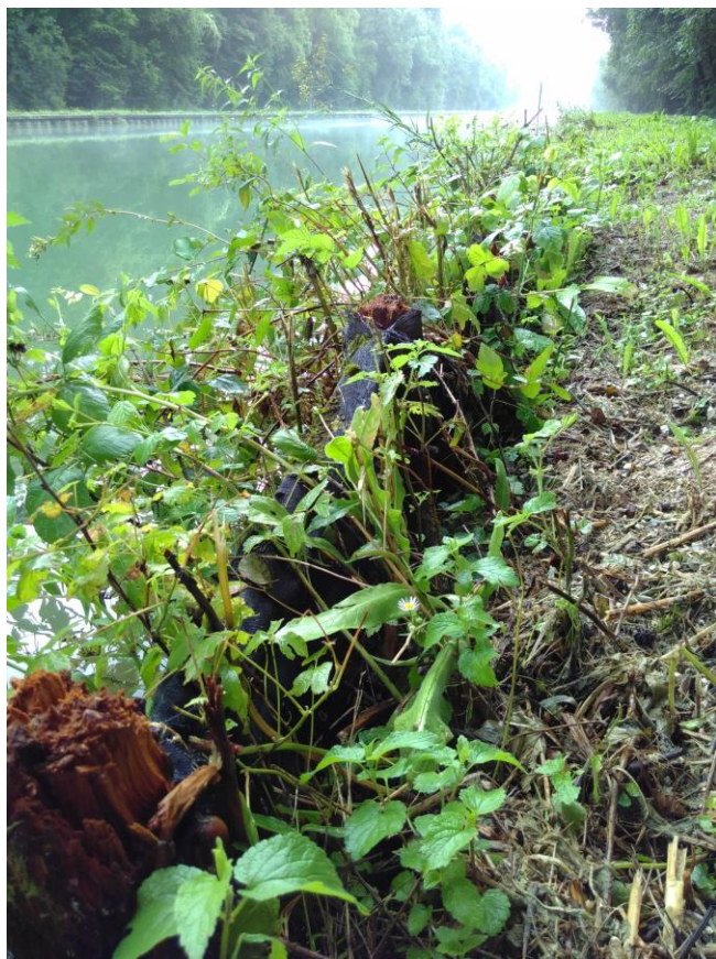
Figure 8. Le tunage en géosynthétique installé en 1990 assure toujours sa fonction de protection de berge, tout en ayant une bonne intégration environnementale