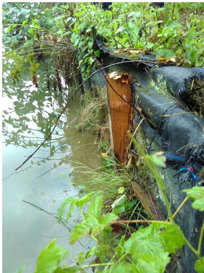
Figure 9. D'après l'exploitant, aucune réparation n'a été nécessaire sur cette planche d'essais, et les dégradations recensées (déchirure, éclatement de la tête des pieux en bois) n'impactent aucunement l'état fonctionnel du tunage géosynthétique